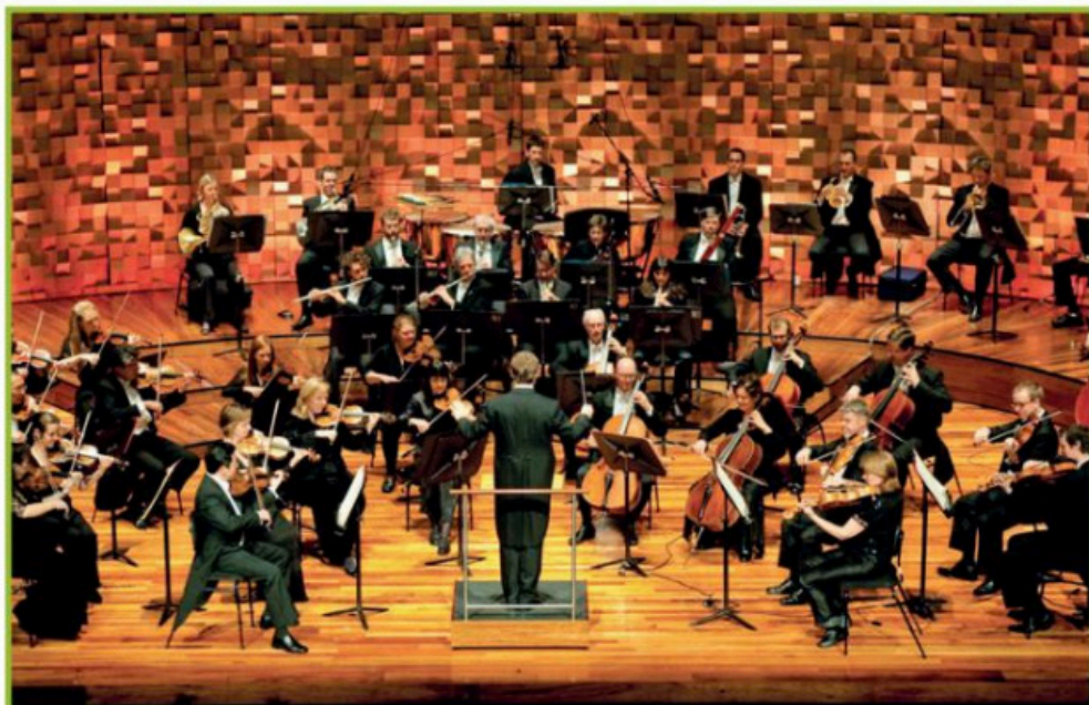
The Tasmanian Symphony Orchestra in full swing

scheduled in a Hobart Comedy Festival (23–31 July).