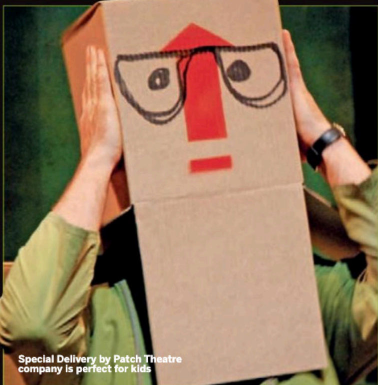
Special Delivery by Patch Theatre company is perfect for kids