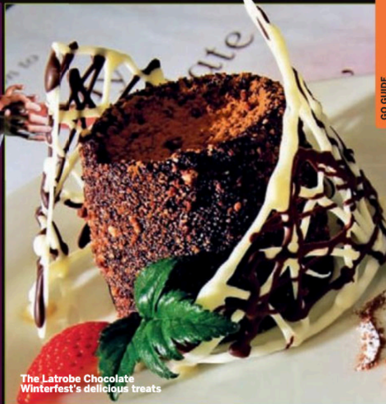
The Latrobe Chocolate Winterfest's delicious treats