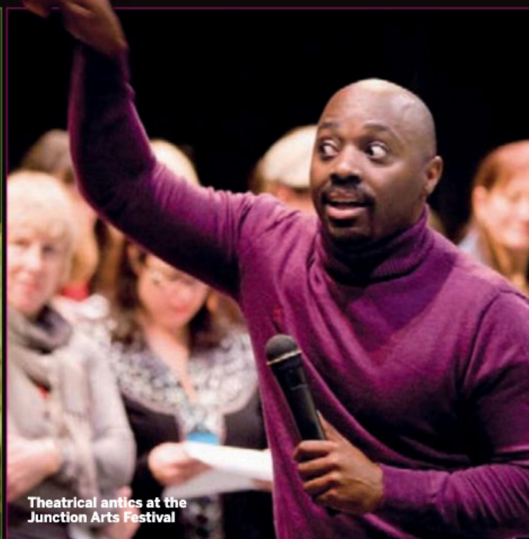
Theatrical antics at the Junction Arts Festival