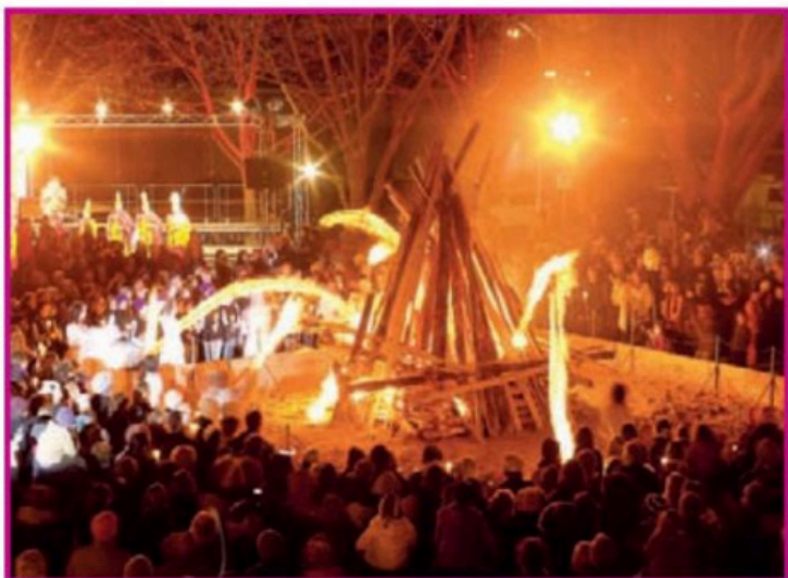
TOP/BOTTOM: Soak up Tasmania's lovely cloak of winter in Hobart; the Festival Bonfire of The Festival of Voices promises much fun and camaraderie

There'll be chocolate-inspired wearable art, finely crafted chocolate desserts, and